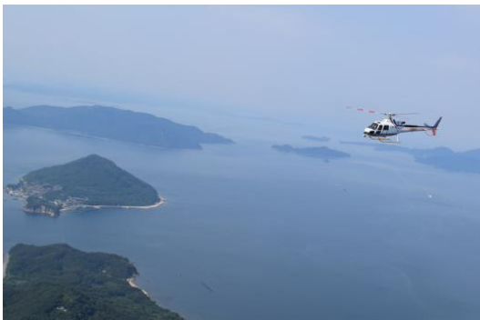
▲今回実証イメージ