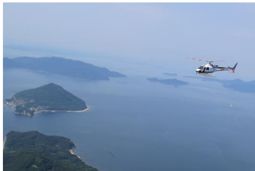
▲今回実証イメージ ※小豆島へ向かうヘリコプター